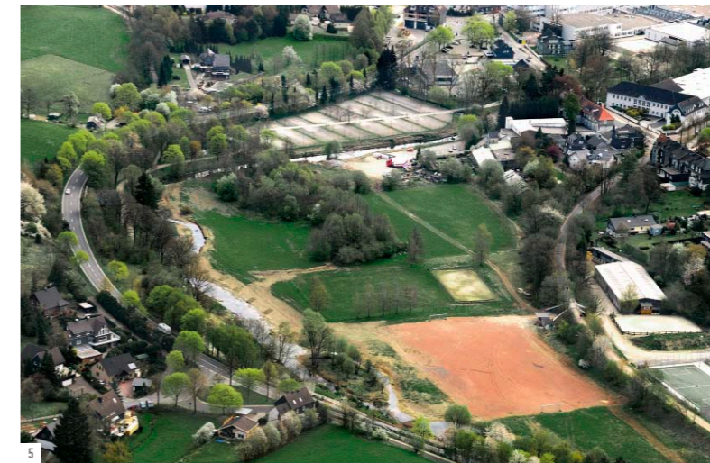
ABB.1 Zentral in den Ohler Wiesen wurde die touristische Basisstation Wasserquintett errichtet. Sie bietet umfangreiche Informationen und ist Ausgangspunkt von Erkundungen im Raum.

Die vielfältigen Nutzungsansprüche an die Ohler Wiesen sowie an das „Wasserquintett“ formulierten den Bedarf nach einem zentralen Informations- und Vermittlungspunkt, dem die Stadt mit dem Bau der „Wasserquintett Basisstation“ entsprochen hat. Zum einen bildet sie den Infopunkt zu den Inhalten und Zielen zum „Wasserquintett“ und zum anderen beheimatet sie die Ausstellung „WupperVielfalt“ der Biologischen Station Oberberg, die mit Mitteln aus dem „Europäischen Fonds für regionale Entwicklung“ (EFRE) realisiert wird. Sie ist der Start- und Zielpunkt von Erkundungen und sportlichen Aktivitäten im Wupperbogen und nicht zuletzt in das gesamte „Wasserquintett“ – eine neue Furt macht's möglich!